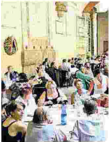
IL BANCHETTO Pranzo per gli ultimi a Palazzo D'Accursio