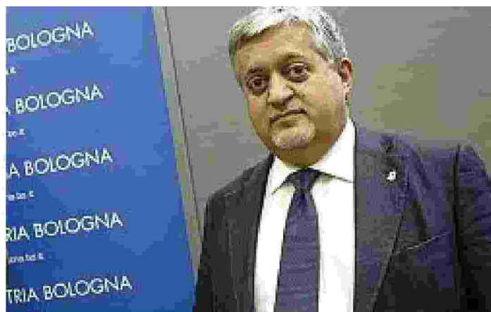
Imprenditore Gianpiero Calzolari è presidente di Granarolo e di BolognaFiere